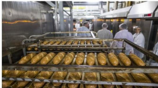
Ilustračné foto