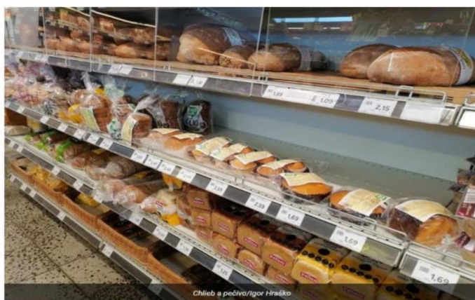
Chlieb a pečivo/Igor Hraško